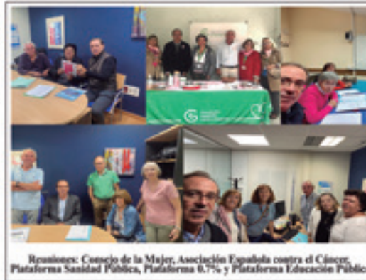
Reuniones: Consejo de la Mujer, Asociación Española contra el Cáncer, Plataforma Sanidad Pública, Plataforma 0.7% y Plataforma Educación Pública

Moción sobre patrocinación a los clubes deportivos de Majadahonda de categoría nacional que proyectan la imagen de la ciudad dentro y fuera de la Comunidad de Madrid: cantidad inicial de 160.000/180.000 € para la temporada 24/25.