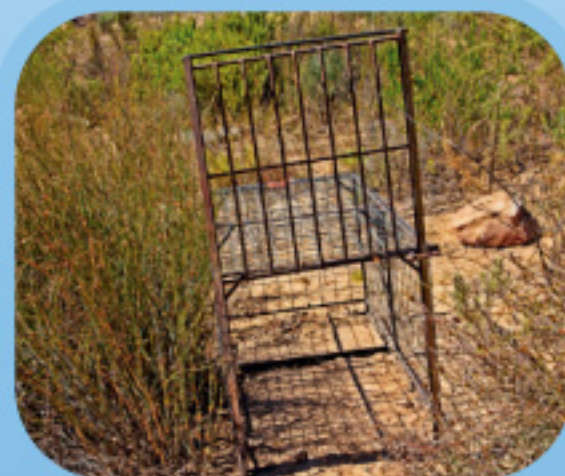
Control de la población mediante la instalación de jaulas trampa en los puntos de riesgo