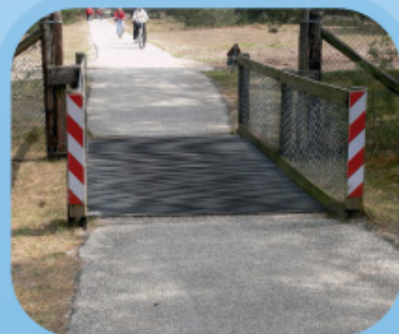
Pasos canadienses en accesos abiertos a la zona urbana.