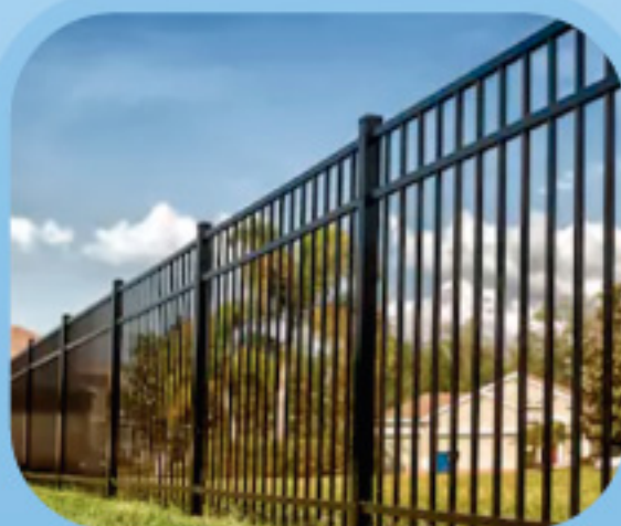
Vallado perimetral reforzado para evitar el acceso de los animales a vías públicas

Entre las medidas que se pueden adoptar destacan: