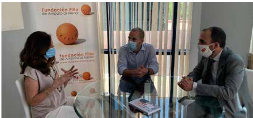
El alcalde, el concejal de Familia y la presidenta de la Fundación Fila.

Toda la información y condiciones del servicio pueden consultarse en la web del Ayuntamiento de Majadahonda: https://www.majadahonda.org y en https://www.fundacionfila.org