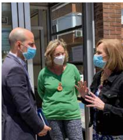
El alcalde junto a la concejal de Bienestar Social durante su visita.